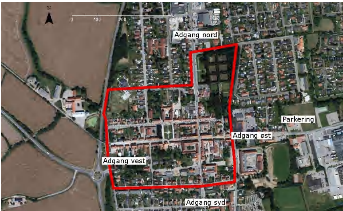
Verdensarvsområdet og adgang

Trekantområdets Brandvæsen & Kolding Kommune By- og Udviklingsforvaltningen 6000 Kolding Tlf.: +45 7979 7979 Fax: +45 2486 1373 E-post: trekantbrand@ trekantbrand.dk Web: www.trekantbrand.dk