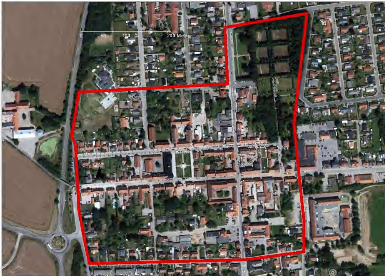
Verdensarvsområdet i Christiansfeld

Trekantområdets Brandvæsen Norgesvej 1 7100 Vejle