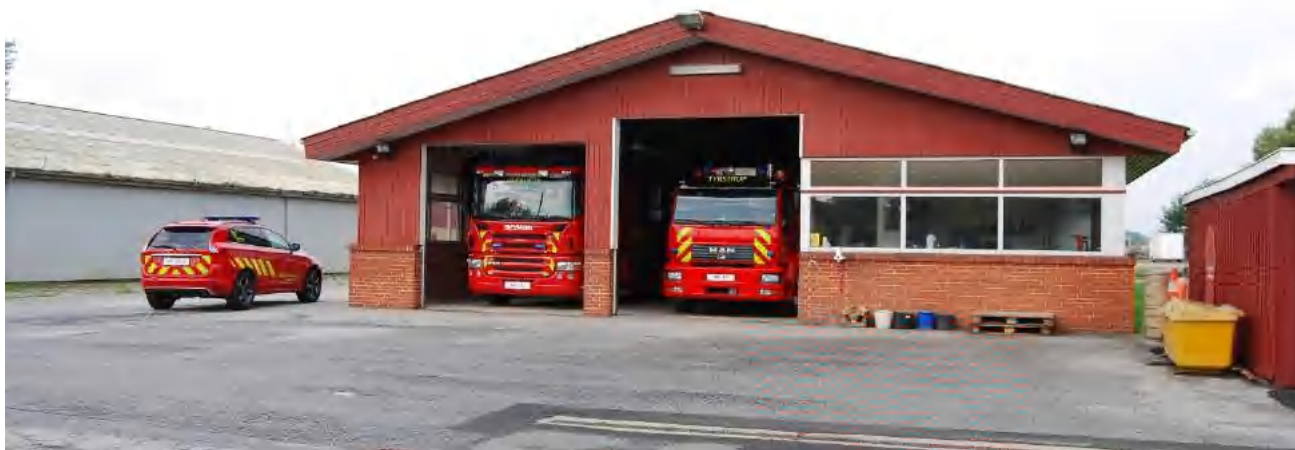
Tyrstrup Brandstation, Christiansfeld

Trekantområdets Brandvæsen & Kolding Kommune By- og Udviklingsforvaltningen 6000 Kolding Tlf.: +45 7979 7979 Fax: +45 2486 1373 E-post: trekantbrand@ trekantbrand.dk Web: www.trekantbrand.dk